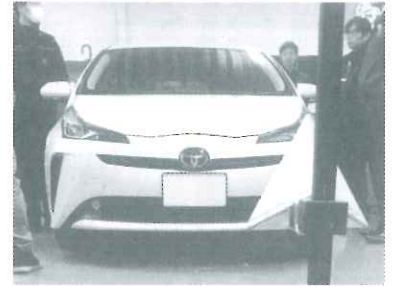
▲エーミングの実施風景(手前の黒い部分がターゲット)・ 写真はBSサミットニュース引用

▲次の時代に備えてJARAグループでは精力的に整備技術の研究も行っている (あいおいニッセイ同和損保の自動車研修所での実車研修風景)