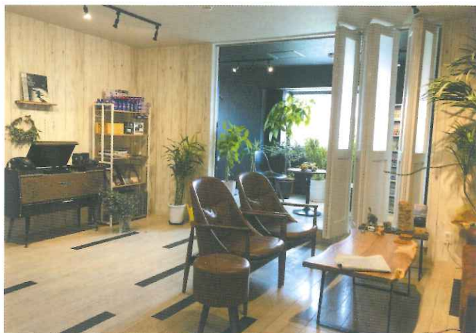
▲カフェ風の商談室が光る