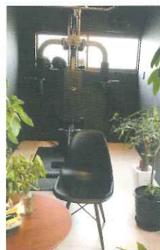
▲商談室のアイキャッチャーはトレーニングマシンだ