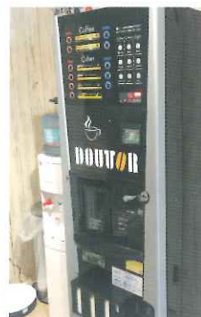
▲ドトールのコーヒーマーカも目立つ